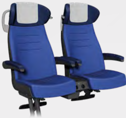
470 mm SITZPLATZBREITE