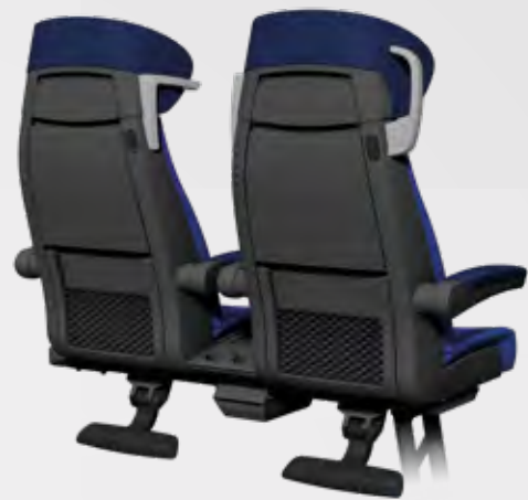
470 mm SITZPLATZBREITE RÜCKSEITE