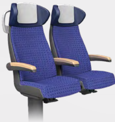
450 mm SITZPLATZBREITE