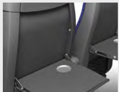
Rückenklapptisch mit Bechermulde