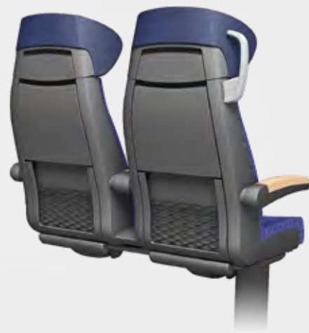
450 mm SITZPLATZBREITE RÜCKSEITE