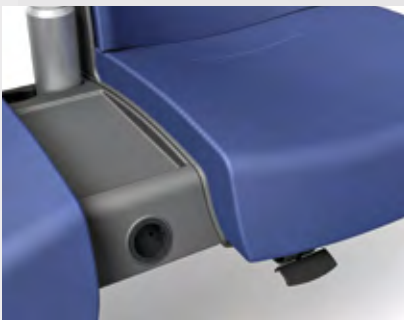
Funktionale Mittelkonsole mit Steckdose