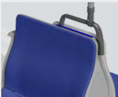
Füllstück für Doppelgesitze

Der LIFELINE bietet aufgrund seiner modularen Bauweise eine hohe Breitenvarianz. Seine Konzeption ist ideal für die Einzel-, Doppel- und Reihenbestuhlung in Tram, U-Bahn oder Metro.