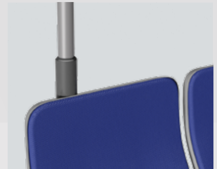
Haltestangen- anschluss ohne Griff