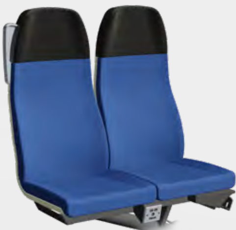
VARIO RELAX 3000