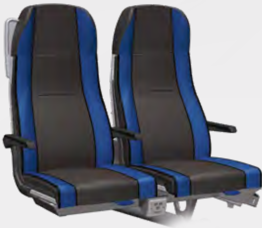
VARIO RELAX 3000 R