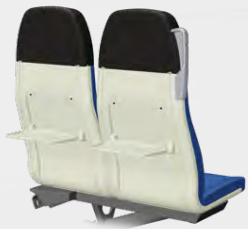
VARIO RELAX 3000 RÜCKSEITE