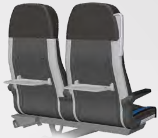
VARIO RELAX 3000 R RÜCKSEITE