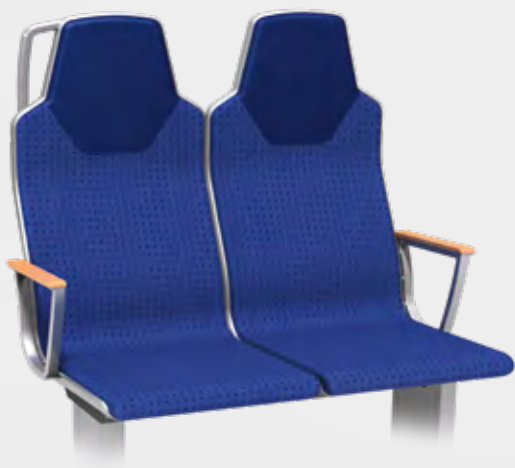
VARIO RELAX 2000