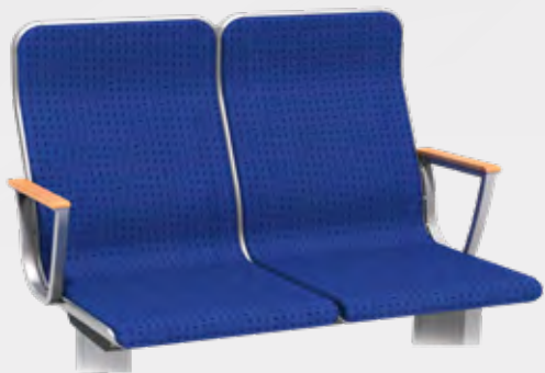
VARIO RELAX 1000