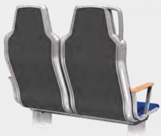
VARIO RELAX 2000 RÜCKSEITE