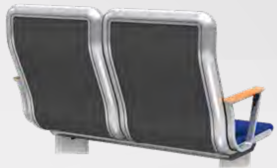
VARIO RELAX 1000 RÜCKSEITE